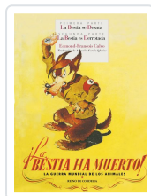
¡LA BESTIA HA MUERTO!