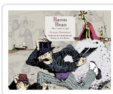
BARÓN BEAN GEORGE HERRIMAN