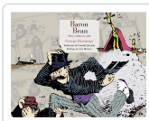
BARÓN BEAN GEORGE HERRIMAN