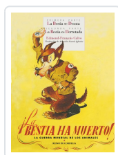
¡LA BESTIA HA MUERTO!