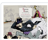
BARÓN BEAN GEORGE HERRIMAN