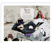
BARÓN BEAN GEORGE HERRIMAN