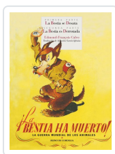
¡LA BESTIA HA MUERTO!