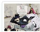
BARÓN BEAN GEORGE HERRIMAN