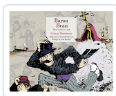
BARÓN BEAN GEORGE HERRIMAN