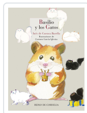
BASILIO Y LOS GATOS DE CUENCA BARELLA, INÉS; DE CUENCA Y PRADO, LUIS ALBERTO