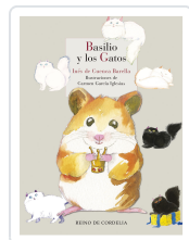
BASILIO Y LOS GATOS DE CUENCA BARELLA, INÉS; DE CUENCA Y PRADO, LUIS ALBERTO