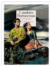
CUMBRES BORRASCOSAS MARINO ESPUELAS, ALICIA