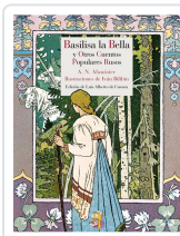
BASILISA LA BELLA Y OTROS CUENTOS POPULARES RUSOS AFANÁSIEV, ALEKSANDR NIKOLÁYEVICH