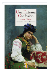
UNA EXTRAÑA CONFESIÓN CHÉJOV, ANTÓN