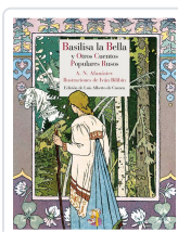
BASILISA LA BELLA Y OTROS CUENTOS POPULARES RUSOS AFANÁSIEV, ALEKSANDR NIKOLÁYEVICH