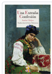
UNA EXTRAÑA CONFESIÓN CHÉJOV, ANTÓN