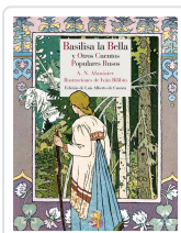
BASILISA LA BELLA Y OTROS CUENTOS POPULARES RUSOS AFANÁSIEV, ALEKSANDR NIKOLÁYEVICH