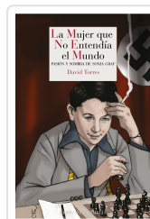
LA MUJER QUE NO ENTENDÍA EL MUNDO TORRES, DAVID