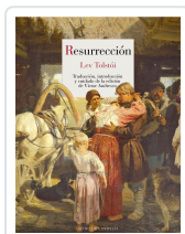
RESURRECCIÓN TOLSTÓI, LEV