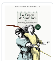
LA VÍSPERA DE SANTA INÉS KEATS, JOHN