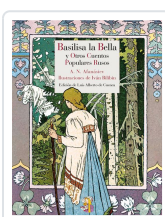
BASILISA LA BELLA Y OTROS CUENTOS POPULARES RUSOS AFANÁSIEV, ALEKSANDR NIKOLÁYEVICH