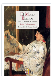
EL MONO BLANCO GALSWORTHY, JOHN