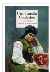
UNA EXTRAÑA CONFESIÓN CHÉJOV, ANTÓN