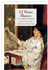
EL MONO BLANCO GALSWORTHY, JOHN