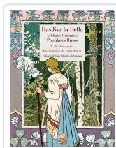
BASILISA LA BELLA Y OTROS CUENTOS POPULARES RUSOS AFANÁSIEV, ALEKSANDR NIKOLÁYEVICH