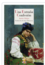
UNA EXTRAÑA CONFESIÓN CHÉROV, ANTON