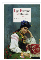
UNA EXTRAÑA CONFESIÓN CHÉJOV, ANTÓN