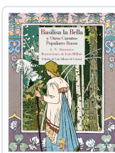
BASILISA LA BELLA Y OTROS CUENTOS POPULARES RUSOS AFANÁSIEV, ALEKSANDR NIKOLÁYEVICH