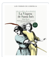
LA VÍSPERA DE SANTA INÉS KEATS, JOHN