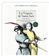
LA VÍSPERA DE SANTA INÉS KEATS, JOHN