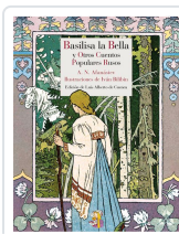
BASILISA LA BELLA Y OTROS CUENTOS POPULARES RUSOS AFANÁSIEV, ALEKSÁNDR NIKOLÁYEVICH