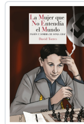
LA MUJER QUE NO ENTENDÍA EL MUNDO TORRES, DAVID