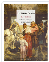
RESURRECCIÓN TOLSTÓI, LEV