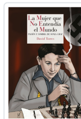
LA MUJER QUE NO ENTENDÍA EL MUNDO TORRES, DAVID