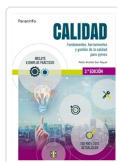
CALIDAD 3ª EDICIÓN ALCALDE SAN MIGUEL, PABLO