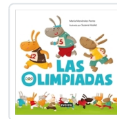
LAS OLIMPIADAS MENÉNDEZ-PONTE CRUZAT, MARÍA