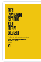
DE MARCO POLO AL LOW COST MARTINEZ SANCHEZ- MATEOS, HÉCTOR/RUBIO MARTÍN, MARÍA