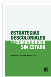
ESTRATEGIAS DESCOLONIALES EN COMUNIDADES SIN ESTADO LOIS, MARÍA / AKKAYA, AHMET