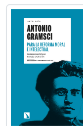
PARA LA REFORMA MORAL E INTELLECTUAL GRAMSCI, ANTONIO