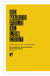
DE MARCO POLO AL LOW COST MARTÍNEZ SÁNCHEZ-MATEOS, HÉCTOR/RUBIO MARTÍN, MARÍA