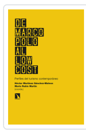
DE MARCO POLO AL LOW COST MARTÍNEZ SÁNCHEZ-MATEOS, HÉCTOR/RUBIO MARTÍN, MARÍA