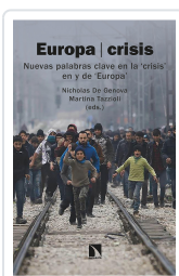
EUROPA/CRISIS DE GENOVA NICHOLAS / TAZZIOLI, MARTINA