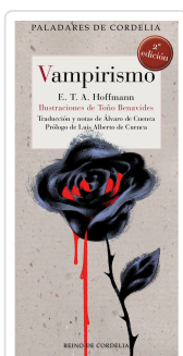
VAMPIRISMO HOFFMANN, E. T. A. [ERNEST THEODOR AMADEUS]