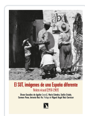
EL SUR, IMÁGENES DE UNA ESPAÑA DIFERENTE GONZÁLEZ DE AGUILAR, ÁLVARO