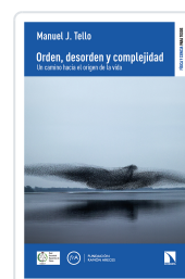
ORDEN, DESORDEN Y COMPLEJIDAD J. TELLO, MANUEL