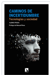
CAMINOS DE INCERTIDUMBRE PRADA, ALBINO