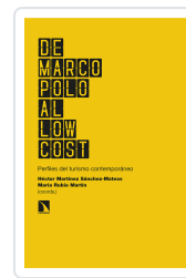
DE MARCO POLO AL LOW COST MARTÍNEZ SÁNCHEZ- MATEOS, HÉCTOR/RUBIO MARTÍN, MARÍA