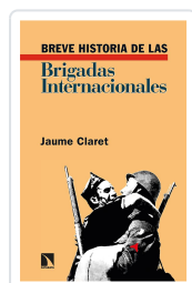
BREVE HISTORIA DE LAS BRIGADAS INTERNACIONALES CLARET, JAUME