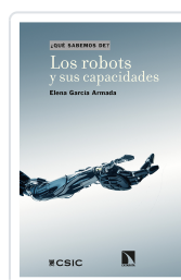
LOS ROBOTS Y SUS CAPACIDADES GARCÍA ARMADA, ELENA