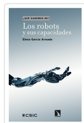
LOS ROBOTS Y SUS CAPACIDADES GARCÍA ARMADA, ELENA