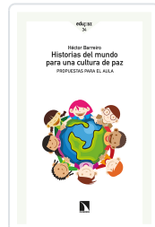
HISTORIAS DEL MUNDO PARA UNA CULTURA DE PAZ BARREIRO, HÉCTOR