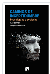
CAMINOS DE INCERTIDUMBRE PRADA, ALBINO