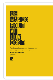
DE MARCO POLO AL LOW COST MARTÍNEZ SÁNCHEZ-MATEOS, HÉCTOR/RUBIO MARTÍN, MARÍA