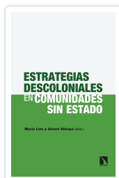
ESTRATEGIAS DESCOLONIALES EN COMUNIDADES SIN ESTADO LOIS, MARÍA / AKKAYA, AHMET