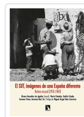
EL SUR, IMÁGENES DE UNA ESPAÑA DIFERENTE GONZÁLEZ DE AGUILAR, ÁLVARO