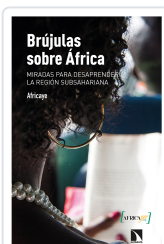
BRÚJULAS SOBRE ÁFRICA AFRICAYE