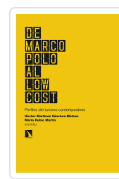
DE MARCO POLO AL LOW COST MARTÍNEZ SÁNCHEZ- MATEOS, HÉCTOR/RUBIO MARTÍN, MARÍA