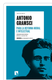
PARA LA REFORMA MORAL E INTELLECTUAL GRAMSCI, ANTONIO