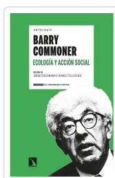
ANTOLOGÍA BARRY COMMONER ECOLOGÍA Y ACCIÓN SOCIAL RIECHMANN, JORGE/TELLECHEA, IRANZU