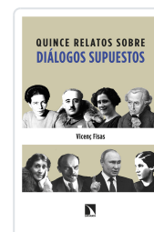
QUINCE RELATOS SOBRE DIÁLOGOS SUPUESTOS FISAS ARMENGOL, VICENÇ