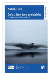
ORDEN, DESORDEN Y COMPLEJIDAD J. TELLO, MANUEL