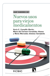
NUEVOS USOS PARA VIEJOS MEDICAMENTOS CAMPILLO MARTÍN, NURIA E. / FERNÁNDEZ ALONSO, MARÍA DEL CARMEN / JIMÉNEZ SARMIE