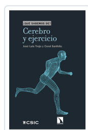
CEREBRO Y EJERCICIO TREJO, JOSÉ LUIS / SANFELIU, CORAL