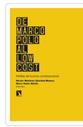
DE MARCO POLO AL LOW COST MARTÍNEZ SÁNCHEZ-MATEOS, HÉCTOR/RUBIO MARTÍN, MARÍA