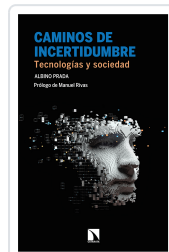
CAMINOS DE INCERTIDUMBRE PRADA, ALBINO