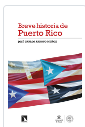
BREVE HISTORIA DE PUERTO RICO ARROYO MUÑOZ, JOSÉ CARLOS