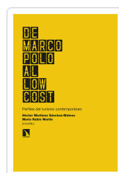
DE MARCO POLO AL LOW COST MARTÍNEZ SÁNCHEZ-MATEOS, HÉCTOR/RUBIO MARTÍN, MARÍA