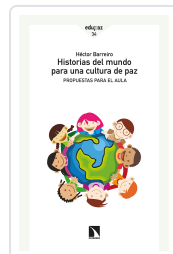
HISTORIAS DEL MUNDO PARA UNA CULTURA DE PAZ BARREIRO, HÉCTOR