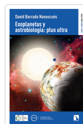
EXOPLANETAS Y ASTROBIOLOGÍA: PLUS ULTRA BARRADO NAVASCUÉS DAVID