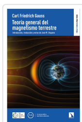
TEORÍA GENERAL DEL MAGNETISMO TERRESTRE FRIEDRICH GAUSS, CARL