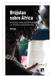
BRÚJULAS SOBRE ÁFRICA AFRICAYE