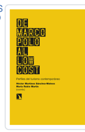
DE MARCO POLO AL LOW COST MARTÍNEZ SÁNCHEZ-MATEOS, HÉCTOR/RUBIO MARTÍN, MARÍA