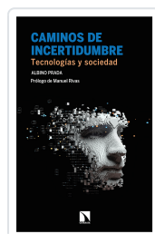
CAMINOS DE INCERTIDUMBRE PRADA, ALBINO