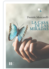
LA CASA DE LAS MIRADAS DANIELE MENCARELLI