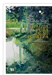
EL AGUA PURA DE MI POBREZA NEGRI, ADA