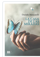
LA CASA DE LAS MIRADAS DANIELE MENCARELLI