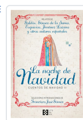
LA NOCHE DE NAVIDAD. CUENTOS DE NAVIDAD II GÓMEZ FERNÁNDEZ, FRANCISCO JOSÉ