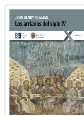
LOS ARRIANOS DEL SIGLO IV NEWMAN, JOHN HENRY