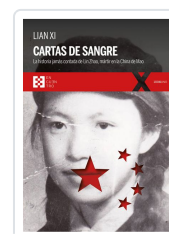
CARTAS DE SANGRE XI, LIAN